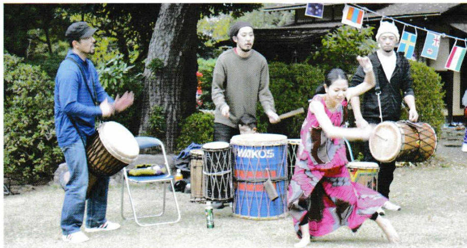
みんぞく ぶ ようけんきゅうかい バラティ民族舞踊研究会