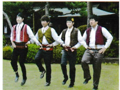
ち ば だいみんぞく ぶ ようけんきゅうかい 千葉大民族舞踊研究会