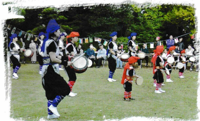
わかもの ちゆうしん おど おきなわ でんどうげいのう いるあざ いしろう げんき こだいこ 若者を中心として踊られる沖縄の伝統芸能の「エイサー」を色彩やかな衣装と元気な子太鼓のリズムと よこぶえ ねいろ かな みな みどり ていえん ひろう きれいな横笛の音色を奏でながら皆さんが緑の庭園で披露