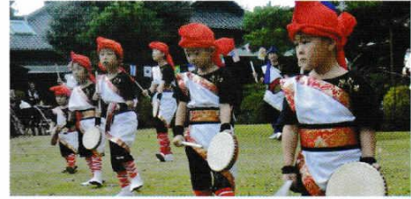
のたみんかげんきゆうかい (野田文化研究会：アシピア エイサーグループ)