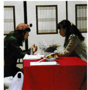
かんていし ほんこん (鑑定士は香港のリリーさん)