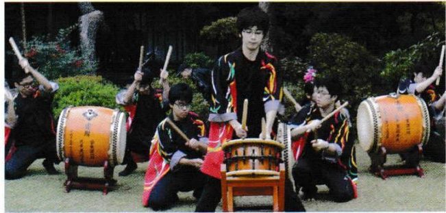
てい えん ちがらづよく ひび わだ い こ 庭園に力強く響く和太鼓