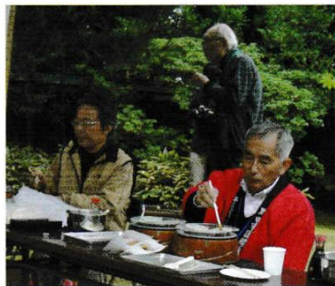
まいかい こうひょう やき 毎回、好評のせんべい焼きコーナー