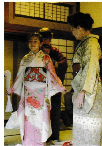
にほん じょう ガーナと日本のお嬢さん、お母さんの初めて着る和服に大喜び