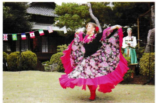
にほんじん 日本人にお馴染みの なしみ ロシア民謡の曲もバックに みんぞくぶよう ロシア民族舞踊を披露