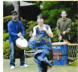
たいこ おいろ 太鼓による音色、リズムがガーナ民族舞踊と似ているせいかガーナの人も踊りに加わり会場を湧かす