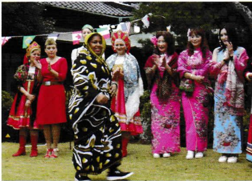
ロシア・インド・ かんこく 韓国