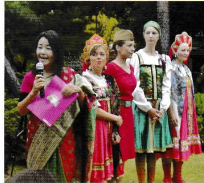
にほん 日本 (?) ・ロシア