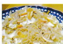
パンシット(フィリピン)